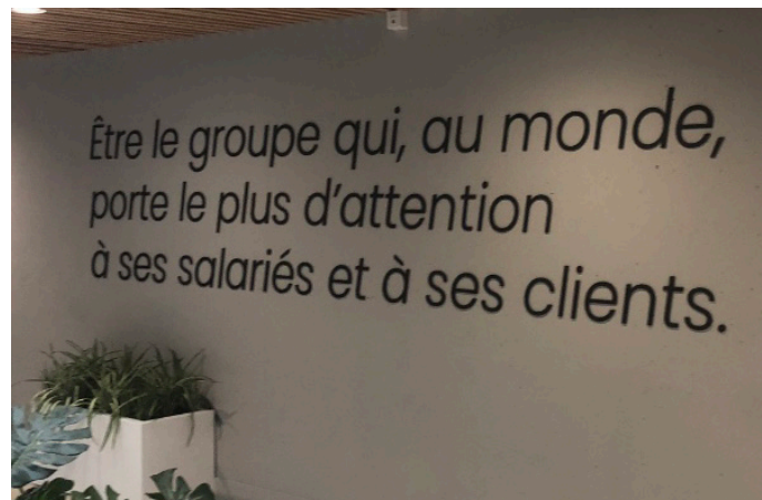
Slogan de l'entreprise au siège du Mans !

On est donc très loin du compte et l'application de la convention collective qui n'est pas en soi une négociation, puisque c'est obligatoire. La direction qui se vante d'être celle, qui, au monde, porte le plus d'attention à ses salarié-es et ses clients doit aujourd'hui l'appliquer !